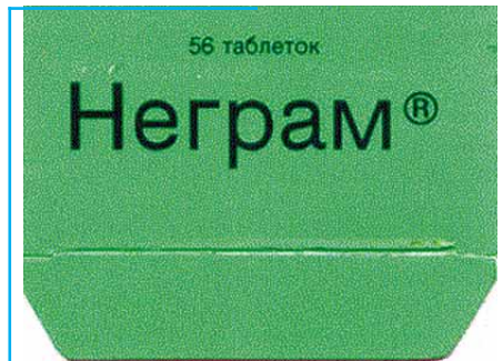
Такая этикетка понятна всем без дополнительных комментариев. Наверняка это гуманитарная помощь.

Вот еще одно дамское средство. На первый взгляд все правильно, одна неувязочка - опрошенные мной дамы в один голос утверждают, что у них нет «боков», есть бедра, талия, в конце концов ягодицы, а вот боков нет! Для чего же тогда предназначен этот крем?